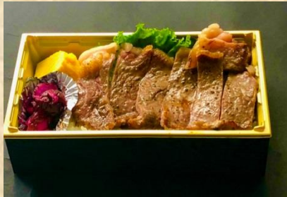
サーロインステーキ重 1,380(税込)