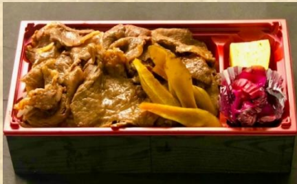
和牛すき焼き重 1,380(税込)