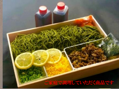
特選かわらそば 1,580(税込)