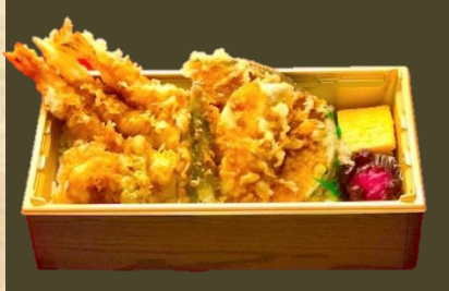
季節の海老天重 980(税込)