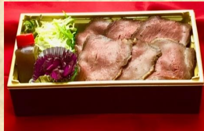
ローストビーフ重 930(税込)